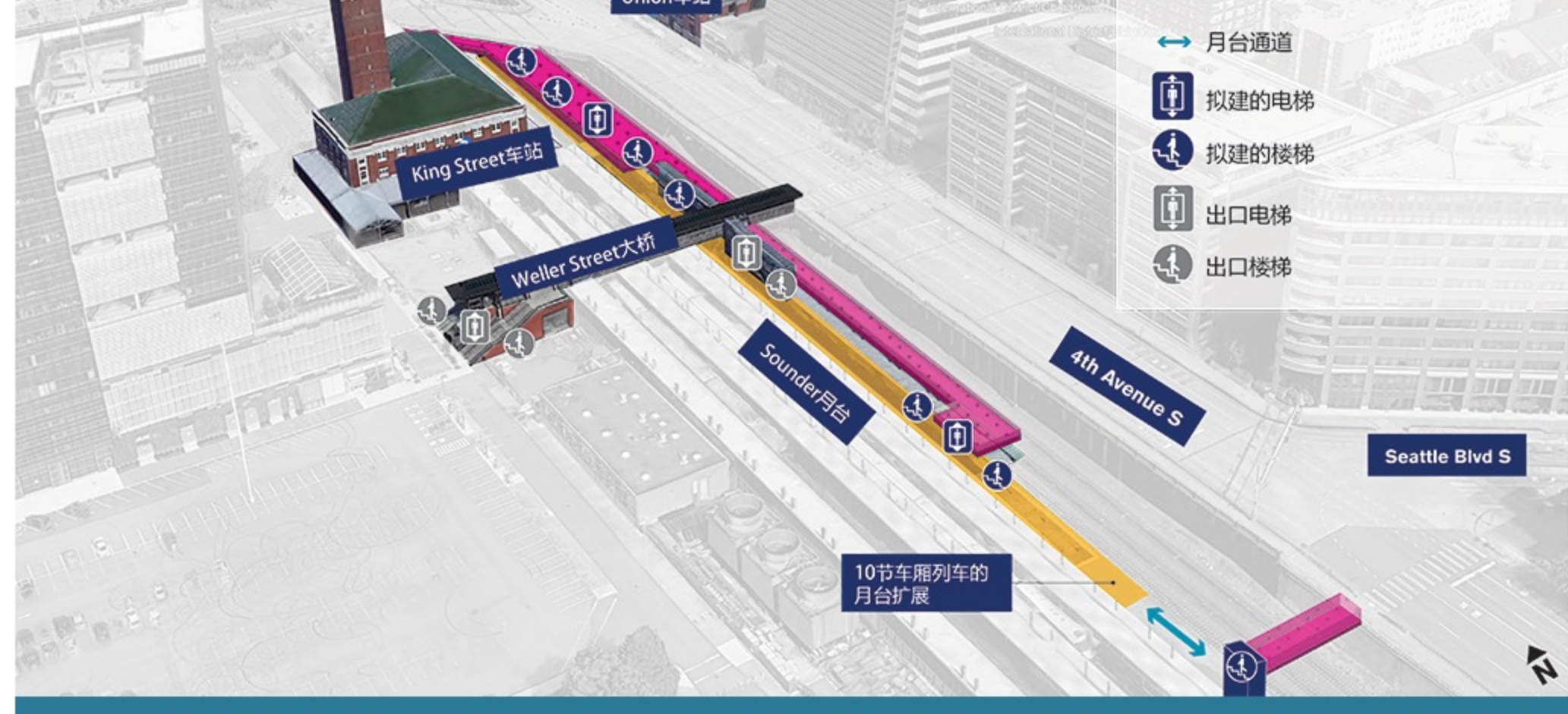
King Street车站潜在改善的鸟瞰图，包含更长的月台、更多潜在楼梯和电梯，以及月台上方的潜在大厅或街道平台。新电梯和楼梯的数量与位置将在下一阶段的设计中确定。| 点击以PDF格式查阅