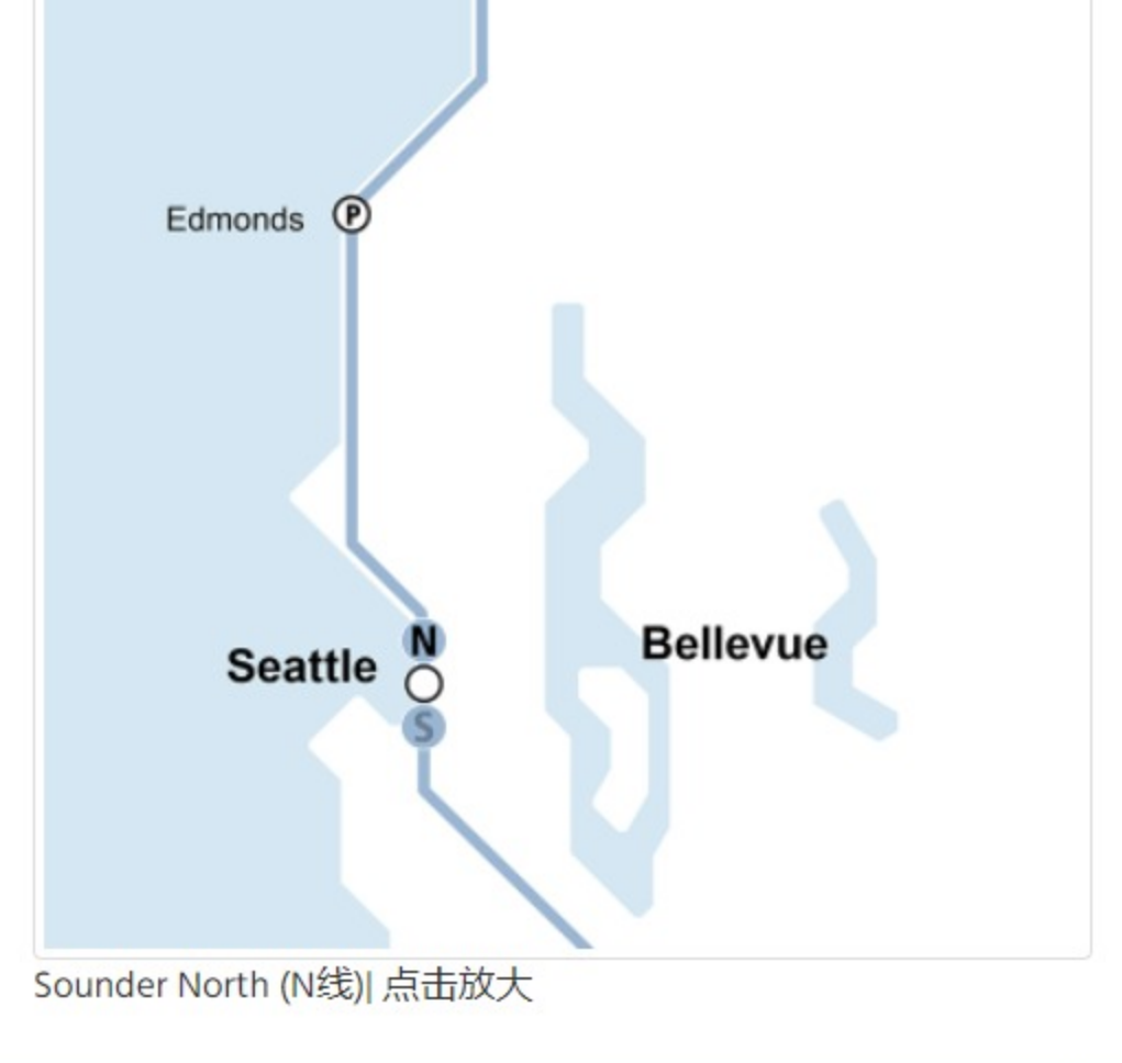
Sounder North (N线) 点击放大