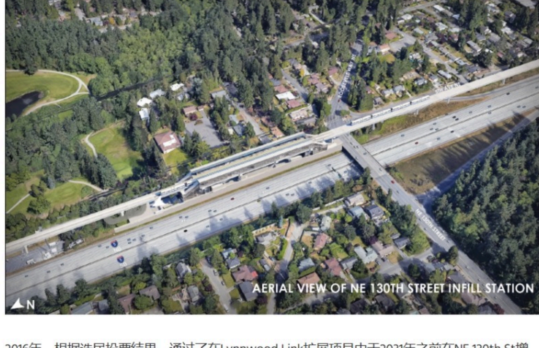
AERIAL VIEW OF NE 130TH STREET INFILL STATION

NE 130th Street 增设车站是 Sound Transit 的 Lynnwood Link 扩展项目的一环，竣工后将为 North Seattle 地区的居民带来更多出行便利。浏览本网站，了解未来两年半内有关车站装修、街景和道路改造施工的信息。深入了解我们准备在 2026 年启用的车站的愿望情况。Lynnwood Link 延长线连接 Northgate 轻轨和 Lynnwood City Center 站，于 2024 年 8 月 30 日开通运营。