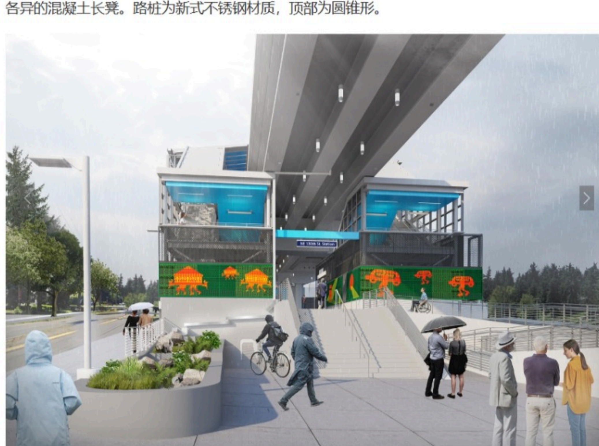
北广场 北广场将设有大量行人设施、前往北大厅的通道、醒目的艺术作品和创造性的生态雨水积水功能设施。*所示艺术作品仅为展示放置位置，并非 Romson Bustillo 的最终作品。 2023 年 5 月 24 日

Sound Transit 设计团队在定稿车站的最终设计时充分考虑了 2020 年秋季收到的反馈意见。设计团队在当时就颜色、座位和路标等细节征求了社区成员的喜好。车站外饰面大面积地采用社区成员优先选择的颜色，尤其是垂直流通的位置（楼梯、电梯和自动扶梯）。座椅的设计以风化石为灵感，将毗邻的 Thornton Creek 特色景观与车站设计相融合，而且还有坐落于广场各处，造型各异的混凝土长凳。路标为新式不锈钢材质，顶部为圆锥形。