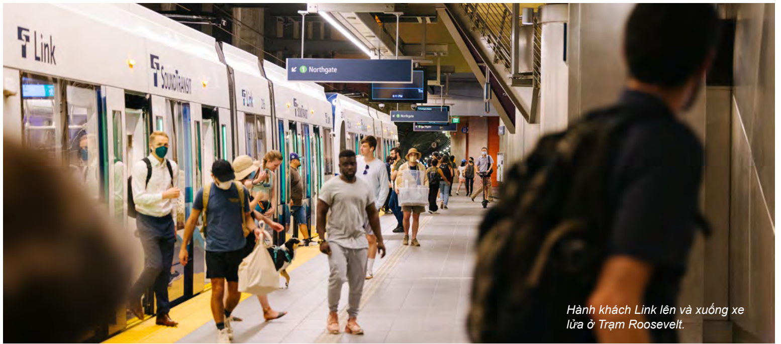
Hành khách Link lên và xuống xe lửa ở Trạm Roosevelt.