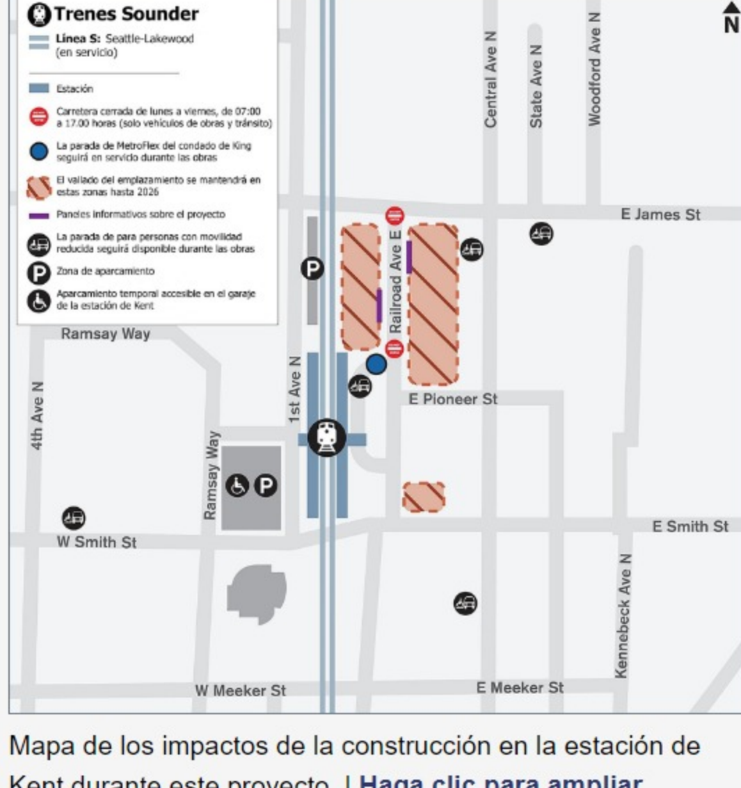
Mapa de los impactos de la construcción en la estación de Kent durante este proyecto. | Haga clic para ampliar