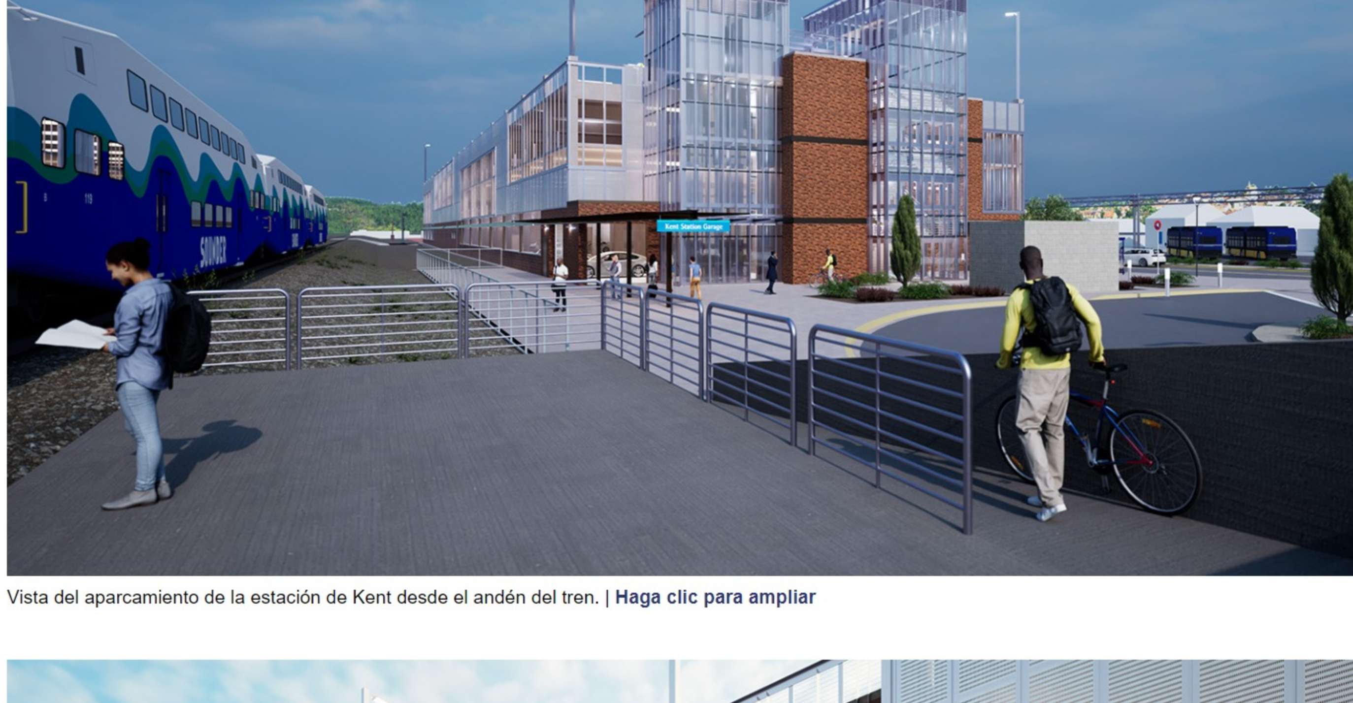
Vista del aparcamiento de la estación de Kent desde el andén del tren. | Haga clic para ampliar