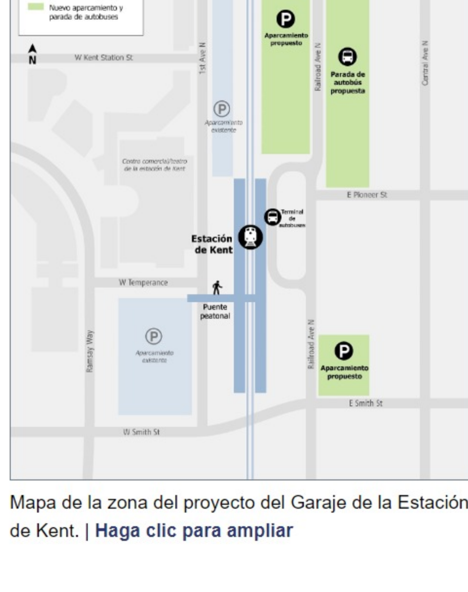
Mapa de la zona del proyecto del Garaje de la Estación de Kent. | Haga clic para ampliar