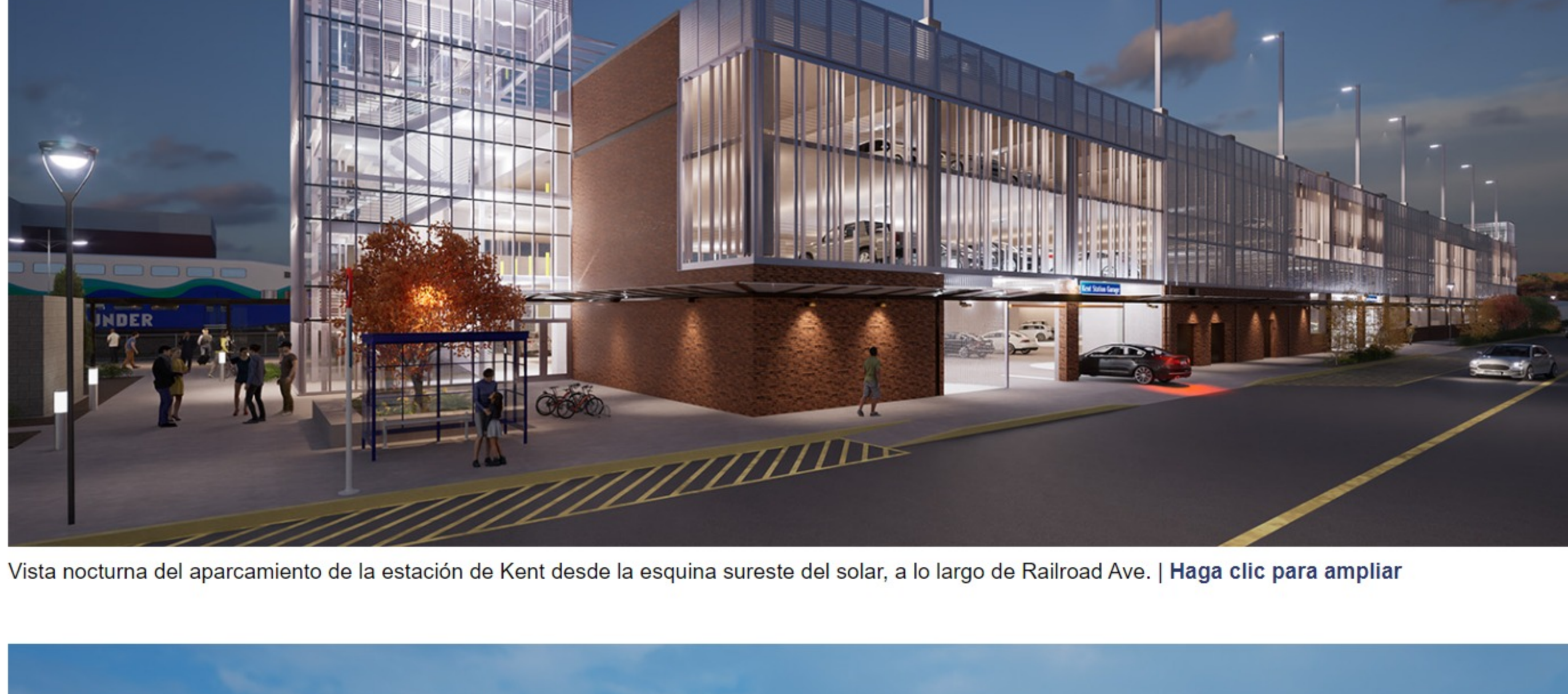
Vista nocturna del aparcamiento de la estación de Kent desde la esquina suroeste del solar, a lo largo de Railroad Ave. | Haga clic para ampliar

En esta sección, verá representaciones artísticas de los diseños del garaje desde varios ángulos. Tenga en cuenta que algunos detalles podrían cambiar cuando completemos el diseño final.