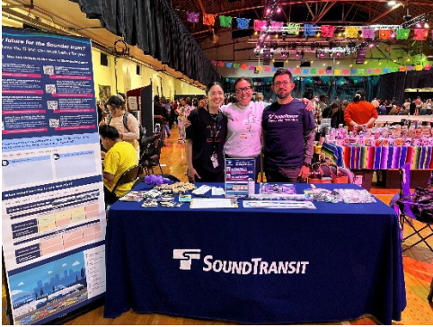
Tacoma LatinX Festival

Shaqaalaha sidoo kale waxay sameeyeen waraysiyo ay la sheegeen hay'adaha jiidan. Waxaa jiray barnaamijyo kala duwan oo wada sheekeysiyadan ka yimid, oo waxaa kamid ah: rabitaank adeegga duhurkii todobaadka dhaxdiisa; rabitaan safaro badan "rakaabka loo daayo" oo shaqaalaha Degmada Pierce dhaxdooda ah; rabitaan xoogan oo adeegga maalmaha fasaxa ah, gaar ahaan xagaaga, ka imanaya meelaha dalxiiska ee Degmada Pierce iyo South King; iyo rabitaan badan oo adeegga duhurkii (labada jiho) oo loogu talo geley ardayda UW-Tacoma.