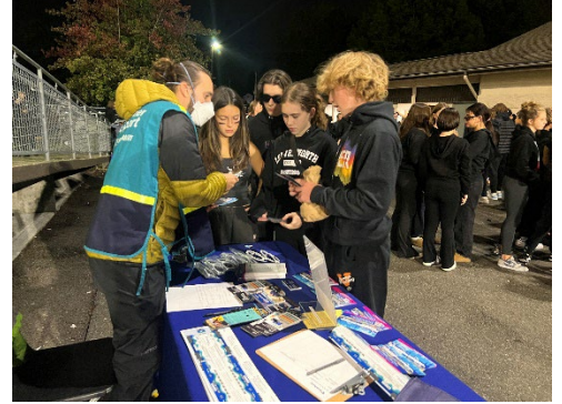
Ciyaaraha kubada Sumner vs Graham-Kapowsin