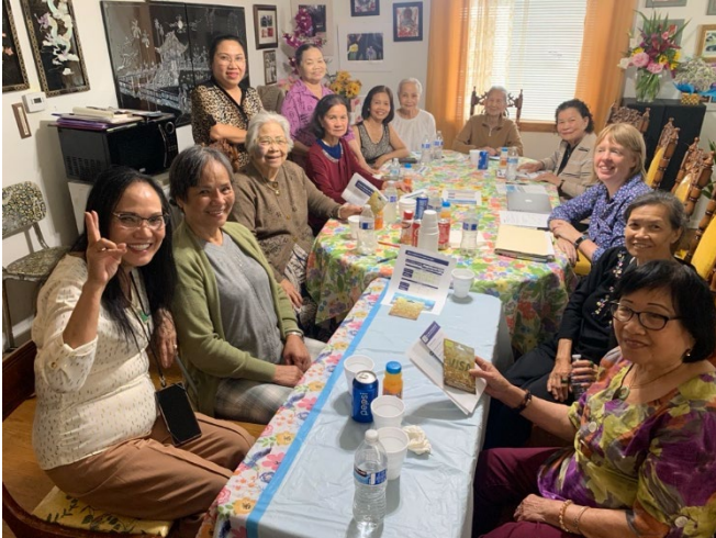
Ang focus group sa Tacoma kasama ang mga miyembro ng dance troupe ng Vietnamese Sunflower.

Nakikipag-ugnayan ang mga kawani sa iba't ibang komunidad na matagal nang kulang sa serbisyo para mapagsilbihan ang apat na focus group para maunawaan ang kanilang mga pangangailangan, mga pattern ng pagbiyahe, mga hadlang sa pagsakay sa tren, at kung paano mas mahusay na mapagsilbihan sila ng S Line. Sa lahat ng focus group, ang pinakamalaking interes ay ang pagdaragdag ng serbisyo sa weekend, na may maraming nagsasabi na gagamitin nila ang Sounder kahit isang beses sa isang buwan para sa mga layuning panlibangan tulad ng pamamasyal at pamimili. Nagkaroon din ng malaking interes sa mga karagdagang serbisyo sa weekday sa iba't ibang oras, kabilang ang madaling araw, umaga, tanghali at gabi sa parehong direksyon para mas masuportahan ang mga swing at graveyard shift.