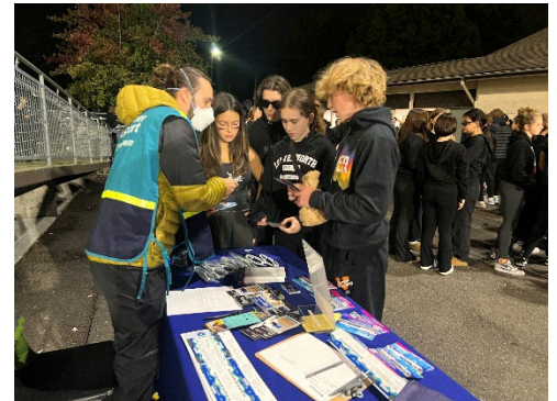
Larong football ng Sumner laban sa Graham-Kapowsin