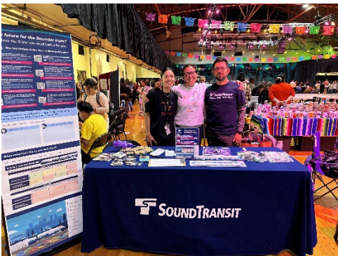
LatinX Festival ng Tacoma

Nagsagawa rin ang mga kawani ng mga panayam sa mga organisasyon sa buong corridor. Mayroong iba't ibang tema mula sa mga pag-uusap na ito, kabilang ang: pagnanais para sa higit pang serbisyo sa tanghali sa kalagitnaan ng linggo; pagnanais para sa higit pang "reverse commute" na mga biyahe sa mga empleyado ng Pierce County; malaking pagnanais para sa serbisyo sa katapusan ng linggo, lalo na sa tag-araw, mula sa mga destinasyong pangturismo sa Pierce at South King County ; at pagnanais para sa higit pang serbisyo sa tanghali (parehong direksyon) para sa mga mag-aaral ng UW-Tacoma.