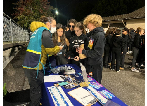
Футбольний матч Sumner проти Graham-Karowsin