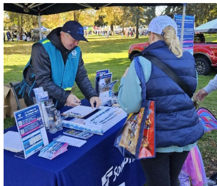
Свято врожаю в місті Оберн на честь Гелловіна