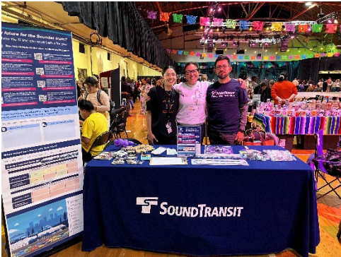
Фестиваль LatinX у Тасота

Співробітники також провели інтерв'ю з організаціями