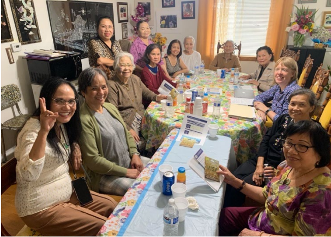
Фокус-група в Тасота з учасниками в'єтнамської танцювальної трупи Sunflower.

Співробітники компанії провели чотири фокус-групи з представниками різних спільнот, історично недостатньо забезпечених послугами, щоб зрозуміти їхні потреби, особливості пересування, перешкоди для поїздок поїздом і те, як лінія S може краще їх обслуговувати. У всіх фокус-групах найбільшу зацікавленість викликало додавання рейсів у вихідні, водночас багато хто відзначив, що користуватимуться поїздами Sounder хоча б раз на місяць для відпочинку, наприклад для огляду визначних пам'яток і здійснення покупок. Також було відзначено велику зацікавленість у додаткових рейсах в обох напрямках у будні дні в різний час, зокрема ранковий, ранній ранковий, денний і вечірній, для кращого обслуговування працівників вечірніх і нічних змін.