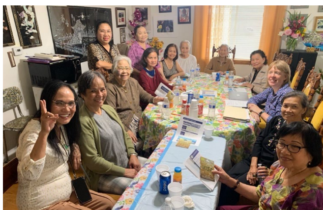
Nhóm tập trung ở Tacoma với các thành viên nhóm mùa Sunflower người Việt Nam.

Nhân viên đã tương tác với nhiều cộng đồng chưa được phục vụ đúng mức trong quá khứ ở bốn nhóm tập trung để hiểu rõ nhu cầu, thói quen đi lại và rào cản của họ khi đi xe lửa cũng như cách cải thiện Tuyến S để phục vụ họ tốt hơn. Ở tất cả các nhóm tập trung, mối quan tâm đặc biệt nhất là bổ sung dịch vụ cuối tuần, nhiều người cho biết họ sử dụng Souder ít nhất một lần mỗi tháng cho mục đích giải trí như đi tham quan và mua sắm. Ngoài ra còn có sự quan tâm đặc biệt đến việc bổ sung các dịch vụ vào ngày thường trong tuần ở nhiều thời điểm khác nhau, bao gồm sáng sớm, gần trưa, giữa ngày và buổi tối ở cả hai hướng để hỗ trợ tốt hơn cho những người làm ca chiều và ca đêm.