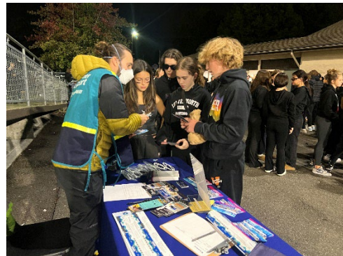
Trận bóng bầu dục giữa Trường Sumner và Trường Graham-Kapowsin