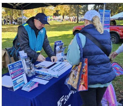
Lễ Hội Thu Hoạch Halloween Auburn