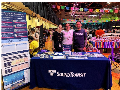
Lễ Hội Tacoma LatinX

Nhân viên cũng tiến hành phỏng vấn với các tổ chức trên toàn hành lang. Có nhiều chủ đề khác nhau từ những cuộc trò chuyện này, bao gồm: mong muốn có thêm dịch